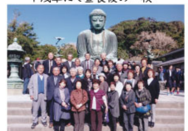
↑鎌倉の大仏前にて