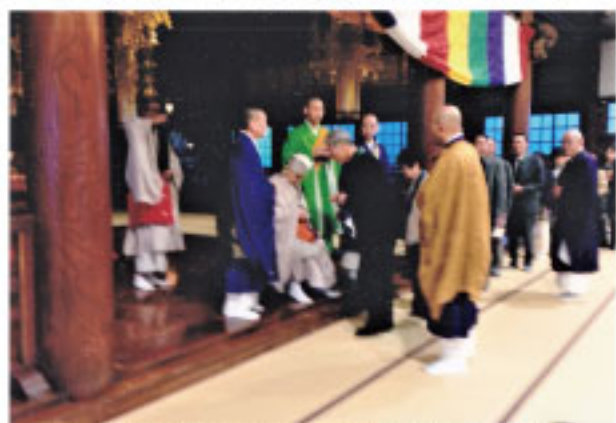
↑朝法座後、御上人様から御賦算