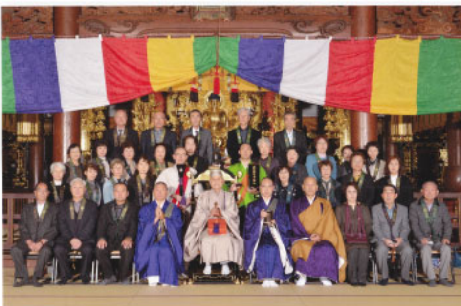
花巻 光林寺 本山団体参拝記念 於 時宗総本山遊行寺本堂 令和元年11月8日(金)

二日目は鎌倉で鶴岡八幡宮や鎌倉大仏をお参りし、横浜中華街での昼食。午後は朝ドラでも話題になったカップヌードルミュージアムを見学して、無事帰路につきました。