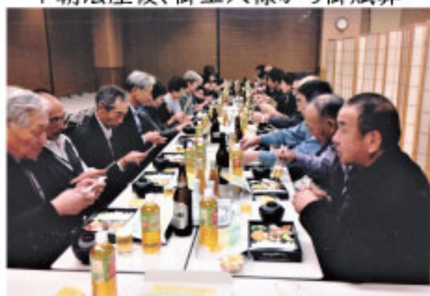
↑総本山食座にて夕食