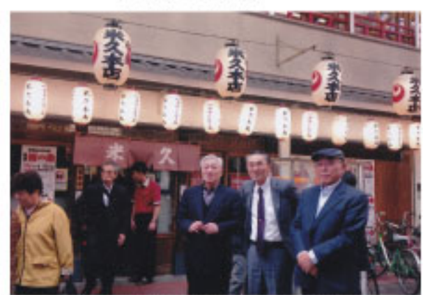
↑浅草にて昼食後の一枚