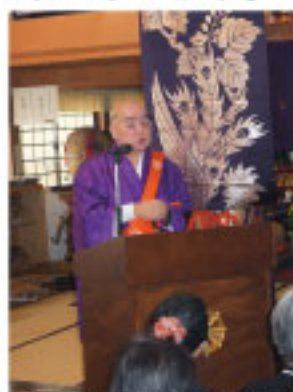
↑ 安儀成沢寺御住職法話