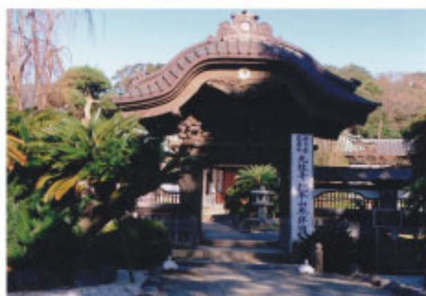
↑総本山中雀門(団参用入り口)