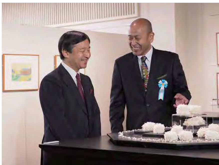
↑ 皇太子殿下と住職

上品で優しさが溢れるようなお人柄を感じる事が出来、感激もひとしお。緊張の中にも素晴らしい時間を頂けたことは有り難く、幸せな体験でした。