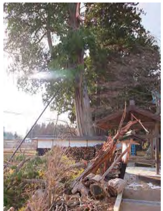
↑ 傾いた塀(写真右下)

これまで長きに渡り、光林寺を見守ってくれている二本の大木を大事にしていかなければ、と思っています。