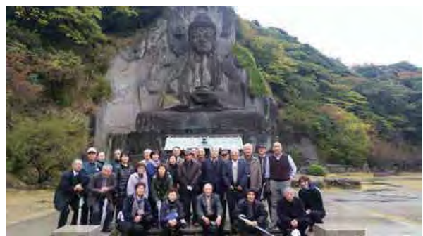
↑鋸山・日本寺の大仏前にて