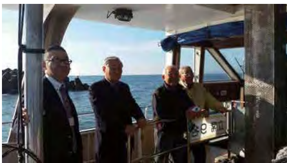
↑観光船上での一枚