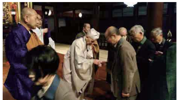
↑真円上人から念仏札の御賦算