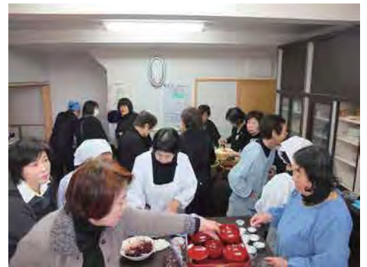
↑ 塔前の皆さん、ご苦労様です。